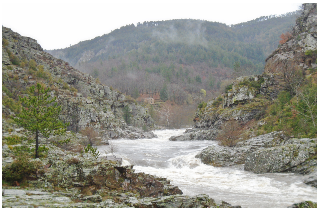
Un Tarn bien agité au mois d'Avril

BULLETIN MUNICIPAL DE LA COMMUNE BÉDOUÈS-COCURÈS - PRINTEMPS 2016