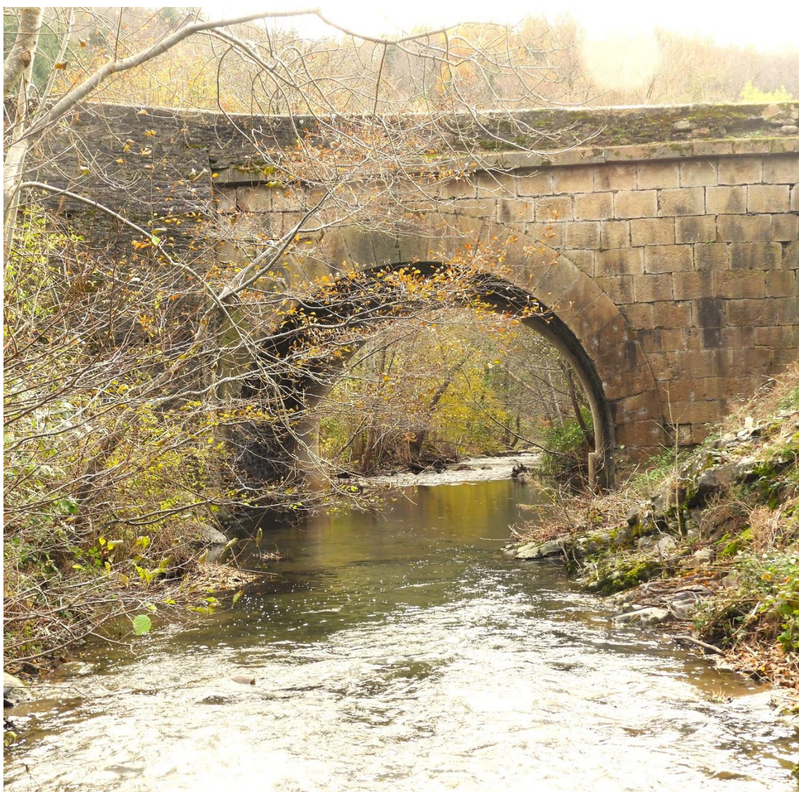
Le pont de La Mingue